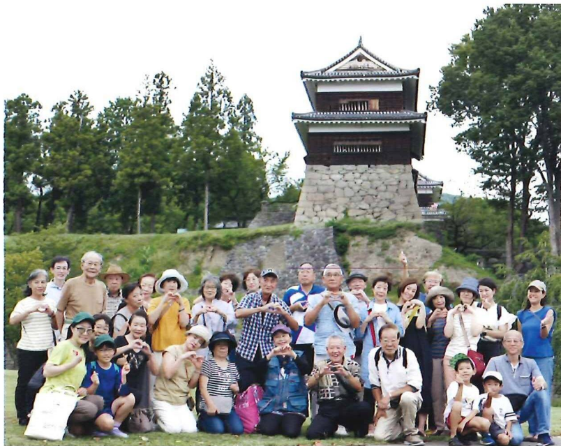
うえだじょう 上田城 みなみやぐらもん 南櫓門にて