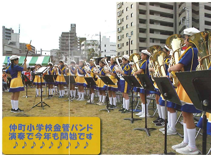
仲町小学校金管バンド演奏で今年も開始です