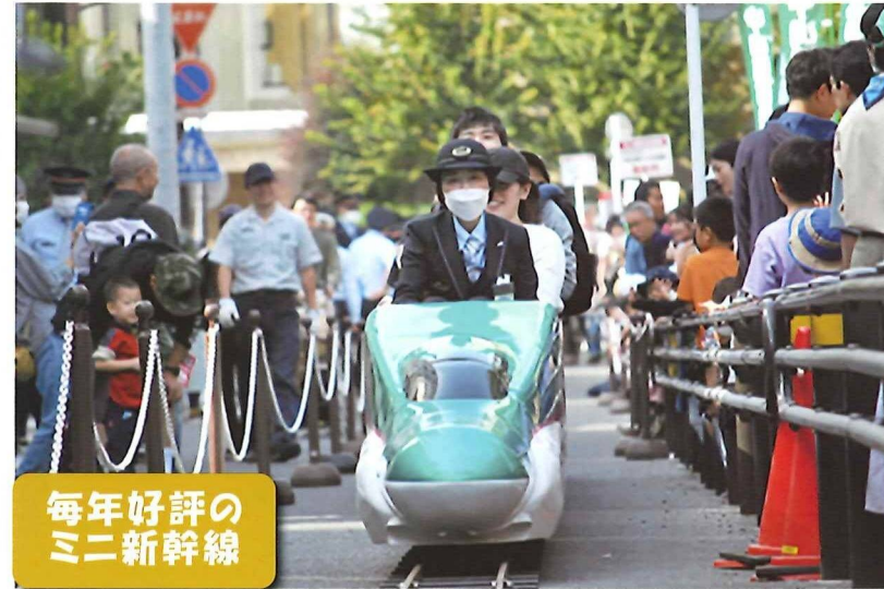
毎年好評のミニ新幹線