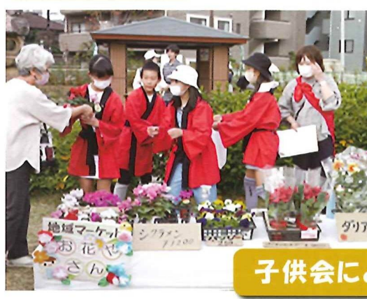
子供会による地域マーケット