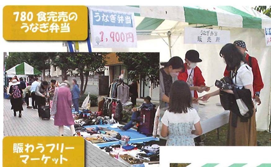
賑わうフリーマーケット