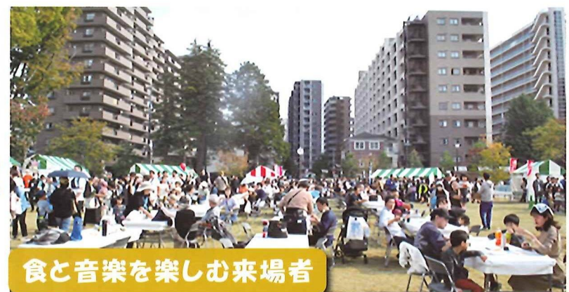
食と音楽を楽しむ来場者